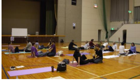
みんなでストレッチ