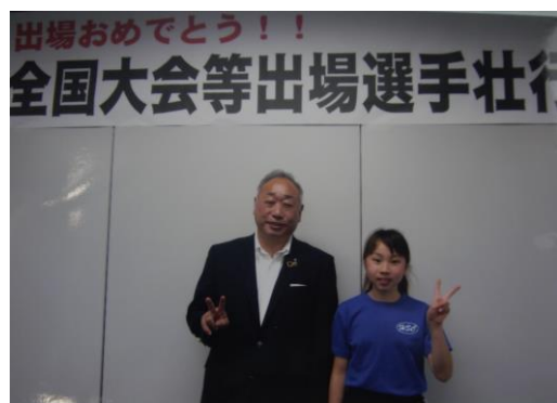
市長と一緒に勝利を誓うVサイン