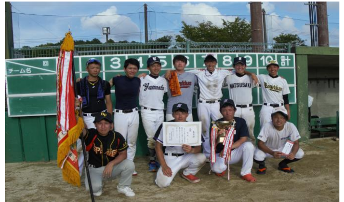
優勝の的矢チーム

いずれにしても64年間続いてきたこの大会が磯部町の宝といっても過言ではありませんね！