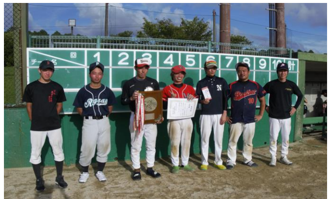
準優勝のセイキチーム