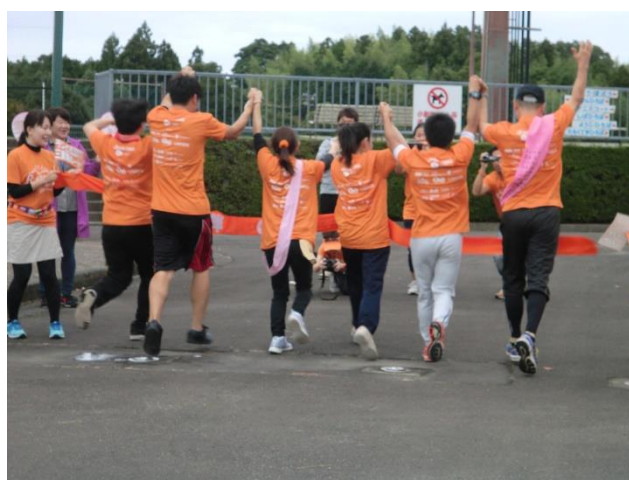
オレンジ色のTシャツが目印

RUN伴（RUN-TOMO）とは・・・認知症の人や家族、支援者、一般人がリレーをしながら、ひとつのタスキをつなぎ、ゴールを目指すイベントです。タスキをつなぐという「非日常的な」体験・出会い・気づきから、認知症の人と一緒に誰もが暮らしやすい地域づくりを提案しています。